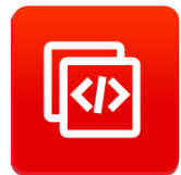
增强型 AT 命令集