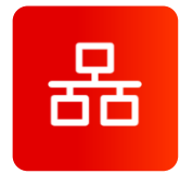
内嵌多种网络 协议栈